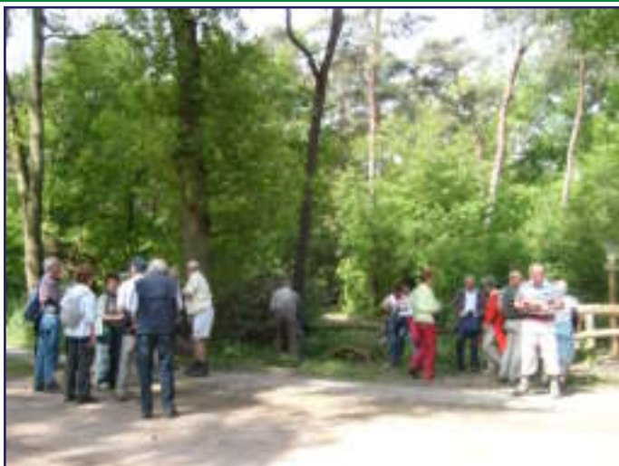
VOORJAARSWANDELING: EFFE PAUZE!!