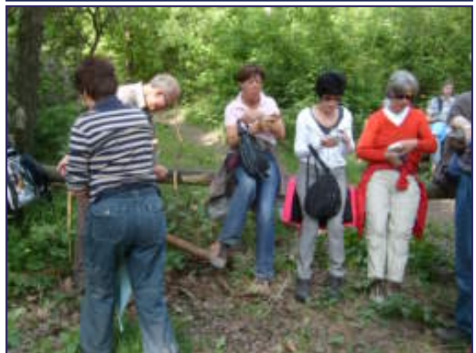
VOORJAARSTOCHT: SMIKKELEN MOET!!