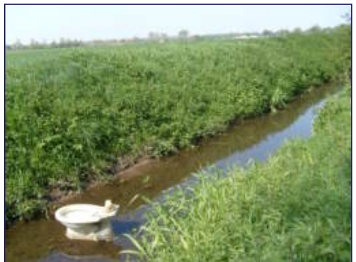
GELIEVE NIET NAAST DE POT TE P...