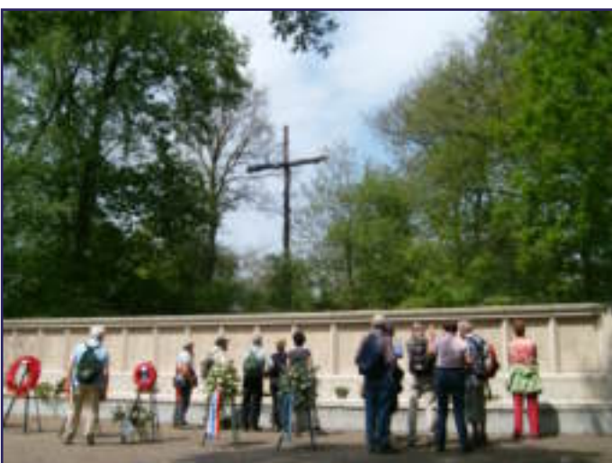
VOORJAARSWANDELING: EVEN STILSTAAN BIJ DE FUSILADEPLAATS IN VUGHT

JE EIGEN HOND MAAKT GEEN LAWAAI HIJ BLAFT ALLEEN MAAR