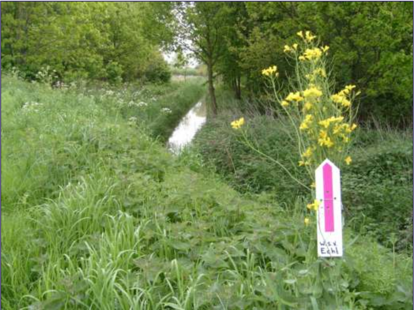
EEN "ZEG HET MET BLOEMEN" ROUTEPIJL TIJDENS DE LENTETOCHT