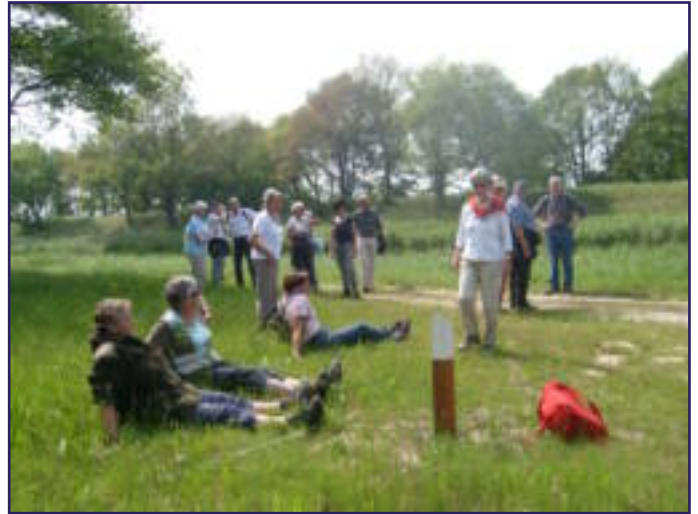
VOORJAARSWANDELING: LEKKER IN HET ZONNETJE!