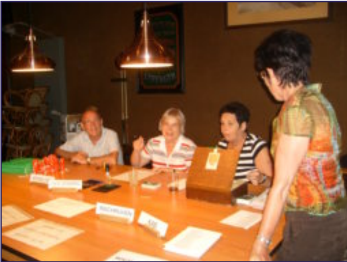
ZONDER HUN (O.A.) GEEN MAANDAGAVONDWANDELINGEN!!!!