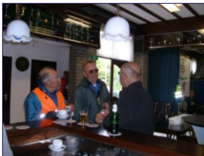
LENTETOCHT: ALLES "LOOPT" OP ROLLETJES....PROOST!!