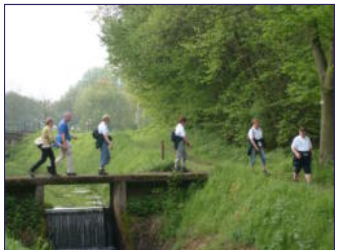
LENTETOCHT: GEVAARLIJKE PASSAGE NABIJ HET "SPAOR" ?

IK KAN ME DE PLAATS ONDERWEG NOG HERINNEREN WAAR IK TOT MIJN VREUGDE DE OPLOSSING VOND (Charles Darwin)