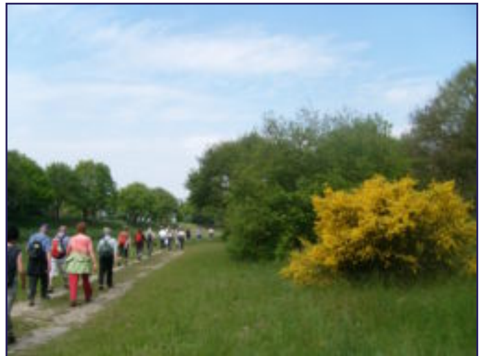
VOORJAARSTOCHT: DE BREMSTRUIK IN BLOEI!!