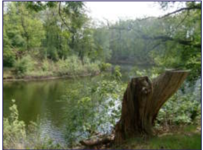
VOORJAARSWANDELING: PRACHTIGE NATUUR!

NIEMAND VERDWAALDE OOI OP EEN RECHTE WEG