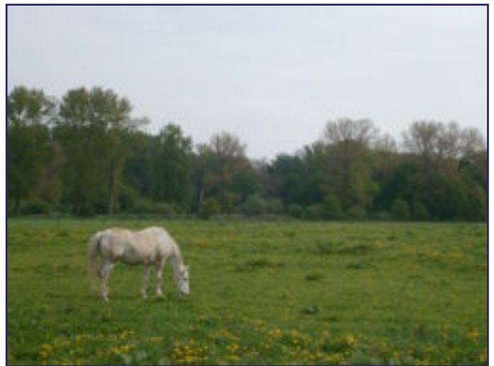
LENTETOCHT: GROEN GRAS, ZON, SCHITTERENDE ROUTE....

Allewiele krisse van die banke ouch mieë pos es van dien eige familie, 't meiste trouwes ouch nog döbbel veur man en vrouw. Ich weit neet of ze det doon in 't kader van de geliekberechtiging van de vrouw, óm de sjótte te sjteune die 't awd papier ophaole of óm de papierproductie en dus de economie te sjtimulere, mer dao wurdt ummer waal 't ein of anger sjmoesje veur gevónje óm dao eine punt aan te lulle. Veur zónne computer mótt det toch ei fluitje van eine cent zeen óm te regele desse dae kraom mer eine kieër kris. Dae computer kènt det, mer die van de bank dus neet. En meestal kómme die breve van 't "HOOFD-KANTOOR". Dao zitte dus de echte "köp", c.q. kop-houte. Doe kris ouch mieë pos es rente.