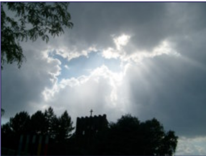
MAANDAGAVONDWANDELING 2E PINKSTERDAG: DE ZON FORCEEERDE EEN OPENING DOOR DE WOLKEN BOVEN DE PIUS X-KERK

ALLEEN GEDACHTEN DIE ONS TIJDENS HET WANDELEN INVALLLEN ZIJN WAARDEVOL