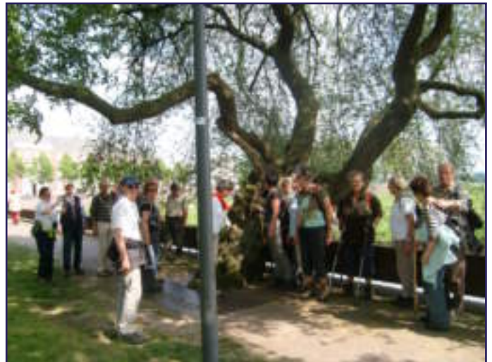
VOORJAARSWANDELING: SAMEN ONDER DE WEICHELBOOM!?

ALLEEN GEDACHTEN DIE ONS TIJDENS HET WANDELEN INVALLLEN ZIJN WAARDEVOL