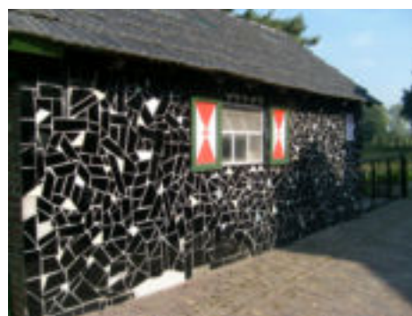
BADKAMER VERBOUWD, TEGELS OVER????