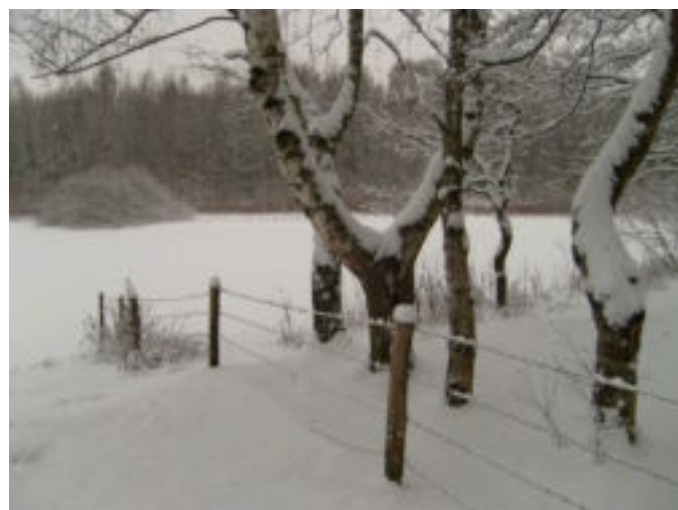
BOOMPJES OM EEN KATTEPULT TE MAKEN?

Wilt u eventueel extra agendapunten opvoeren, geeft u dit dan a.u.b. zo spoedig mogelijk, schriftelijk of via e-mail door aan het secretariaat.