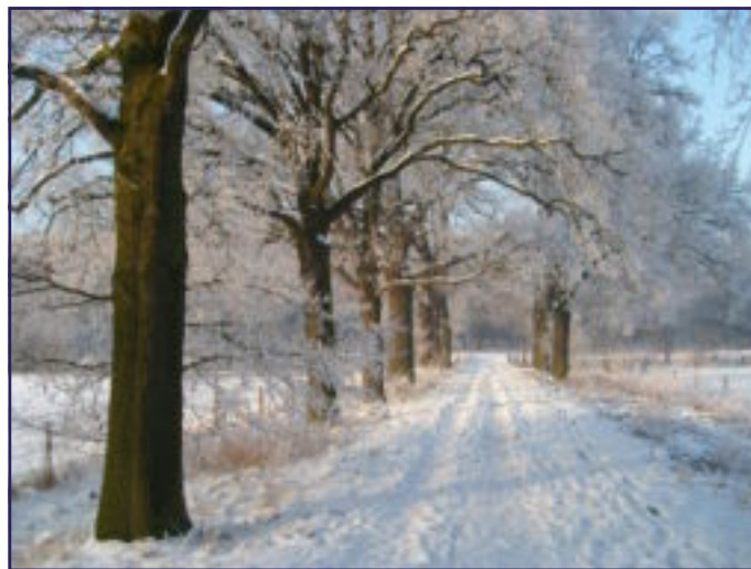
'T IS WEER VOORBIJ, DIE MOOIE ZOMER.....

Geer zeet waal : Wanjelentaere kumpse nog èns urges en doe kris euveral versjtandj van.