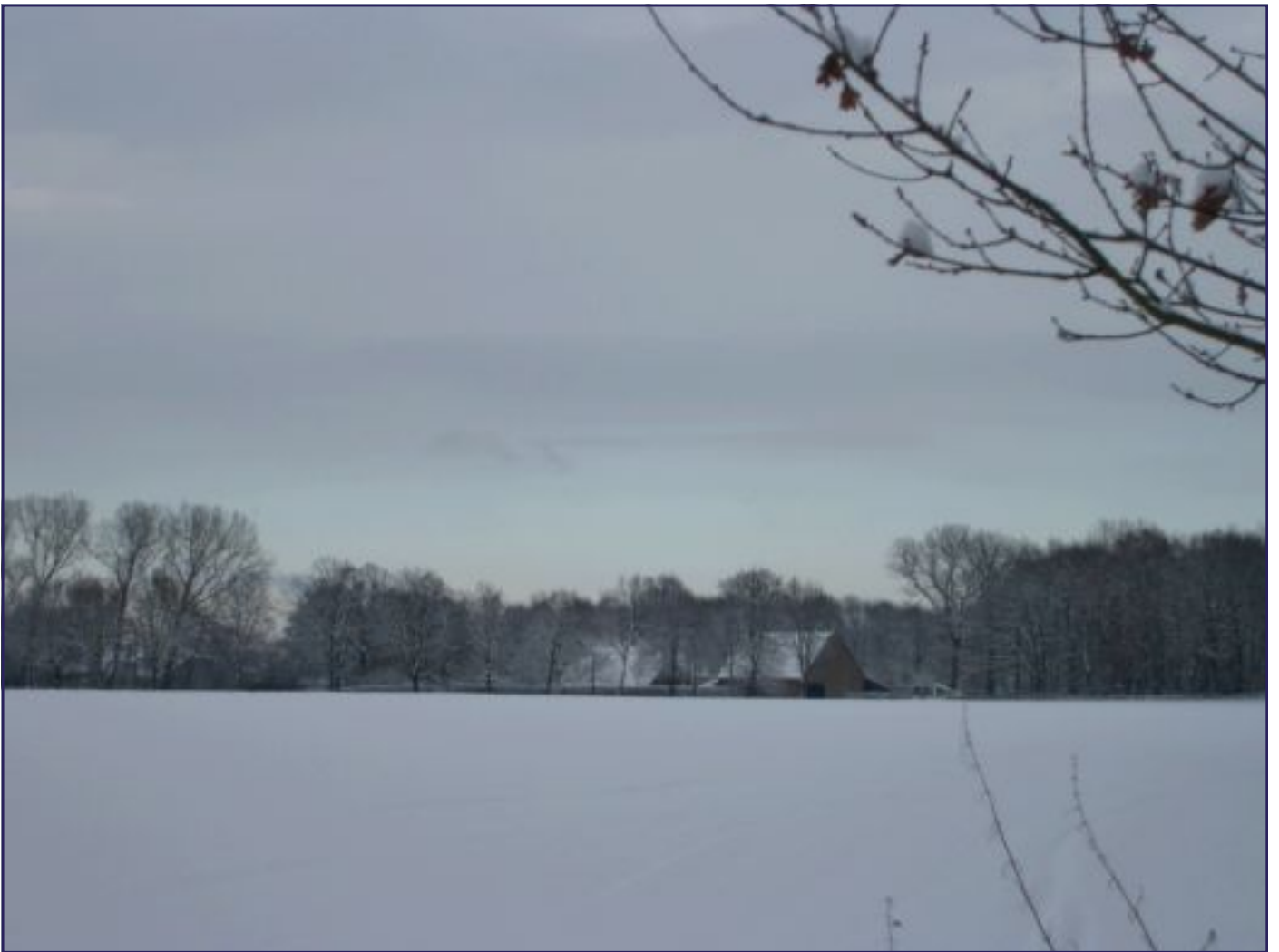
WSV WENST U EEN FIJNE WINTER TOE