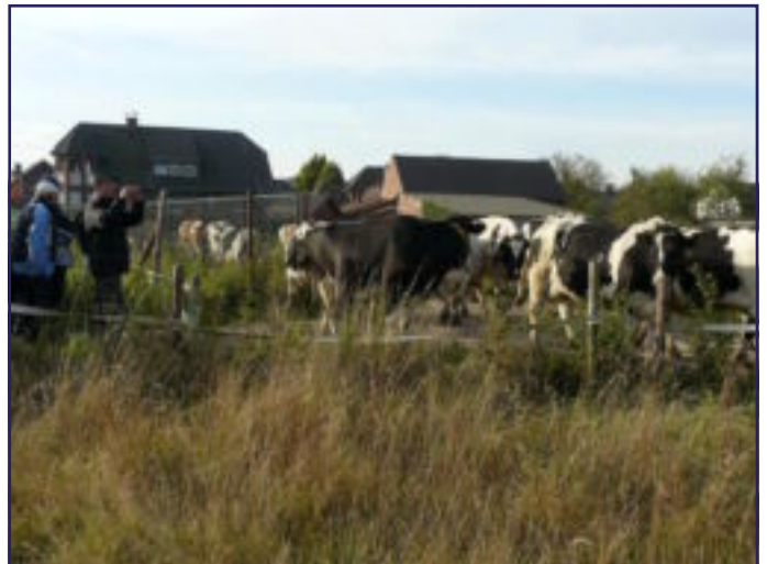
DE KUUJ STAON MIT DE VOT OPPE FOTGRAAF AAN, SJANDALIG....