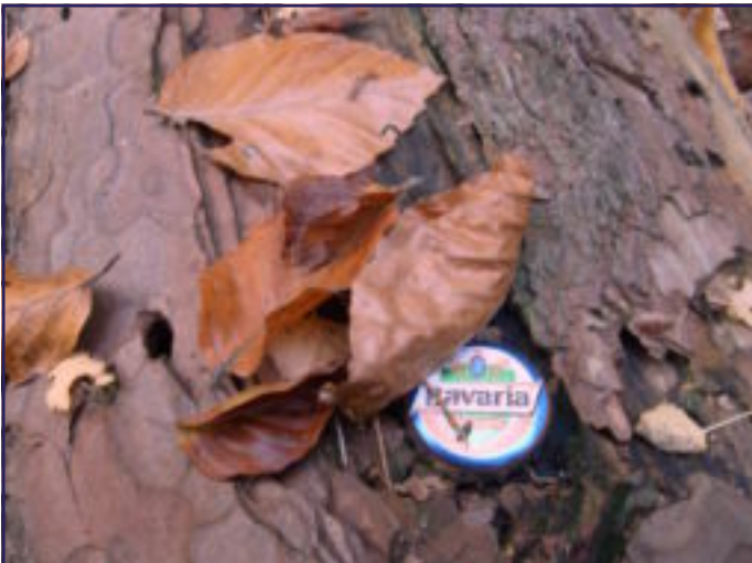
HERFST 2009: DORRE BLADEREN, LEGE DOPPEN.....