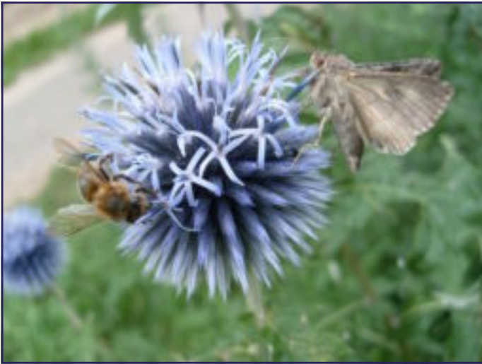
MOOIE BLOEMEN TREKKEN VELE 'SNOEPERS'