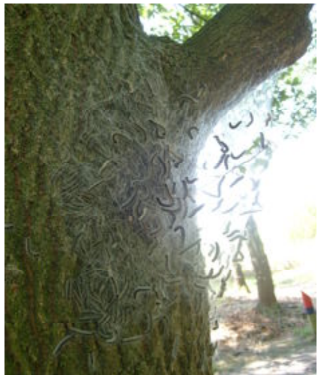
ONZE "VRIEND" DE EIKENPROCESSIERUPS IS OOK WEER AAN DE WANDEL. EEN GOEDE RAAD: LOOP ER OMHEEN!!

Vreuger begóste bie die vrouwluj van ós in 't veurjaor die hormone te wirke en den moosse oetkieke, allewiele zeen die gans "harmlos" en gaon ze den de groate póts doen. Bie eine van die leep de vrouw zoa óm hem haer te sjtóbbe, detter ziene pot beer nog neet mieë zoog sjtaon op 't salontäöfelke. Van gif haw d'r zich oet ziene plunjebaal van deens 't gaasmasker gehaold en det opgezat. Mer ouch det pakde weer verkieërd oet. Wie zien vrouw in koom en dao zónne kael mit zón akelig masker zoog zitte, sjrók die zich bekans 't apezoer en koos d'r al bekans weer mit die nao 't ziekenhoes trèkke mit einen halve hartaanval. Doe zuus waal, esse effe leuk wils zeen, doug 't ouch al weer neet. En es ze zelf mit zón masker van kómkommers en citroene op 't muulke ligke, den moge weer neet sjrikke ! Alle name en toevallige geliekenisse mit besjtaonde persone of persone die geer kènt, zeen oeteraard gemanipuleerd, en de res is ouch neet waor !