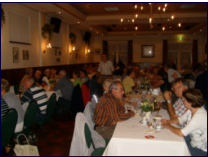
LEDENTOCHT SEPT 2009: EEN SUPER MOOIE WANDELING WERD AFGESLOTEN MET EEN VOORTREFFELIJK SOUPER IN AWD THOEAR. HULDE AAN DE ORGANISATOREN VAN DEZE LEDENTOCHT !!!