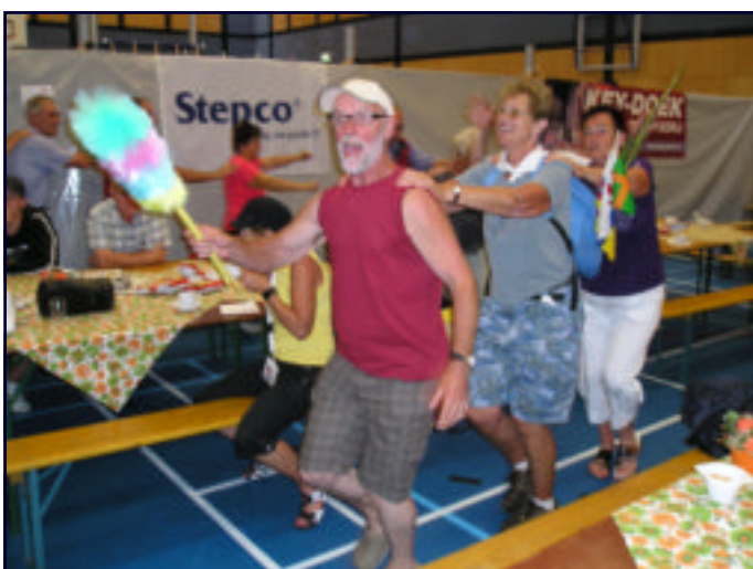
4D NIJMEGEN: EN DE REST ER ACHTERAAN.....waat eine super sjoene daag.

OKTOBER GEEFT ONS WIJN EN ZONNIGE DAGEN MAAR OOK JICHT EN ANDERE PLAGEN