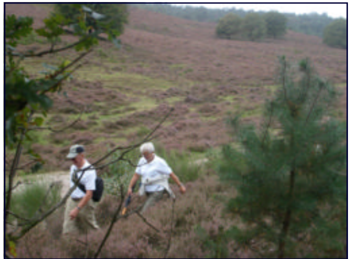
LEDENTOCHT SEPT 2009: MEDE-ORGANISATOR EN ROUTE--UITZETTER NO SAMEN MET NELLIE WANDELEND DOOR DE GLOOIENDE HEIDEVELDEN