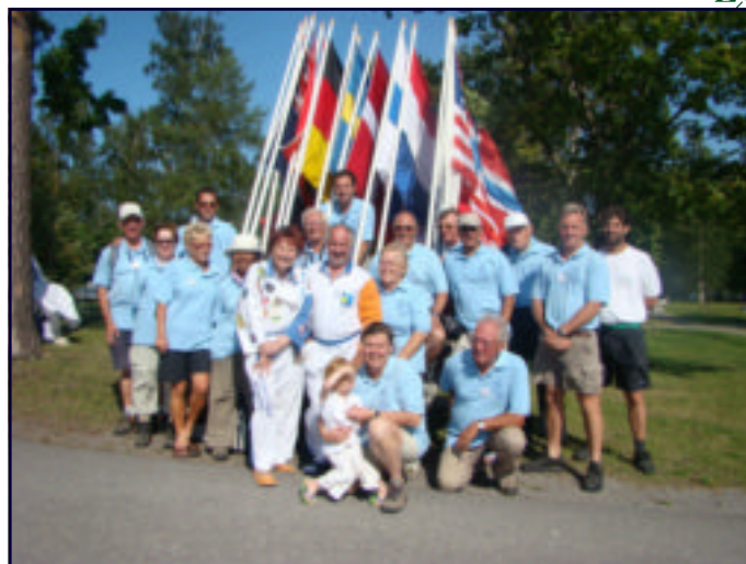
wandeling Finland: onze groepsfoto.