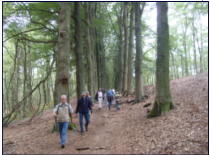
LEDENTOCHT SEPT 2009: WANDELEN OVER DE KILOMETERS-LANGE SCHITTERENDE KONINGSWEG VANAF POSBANK