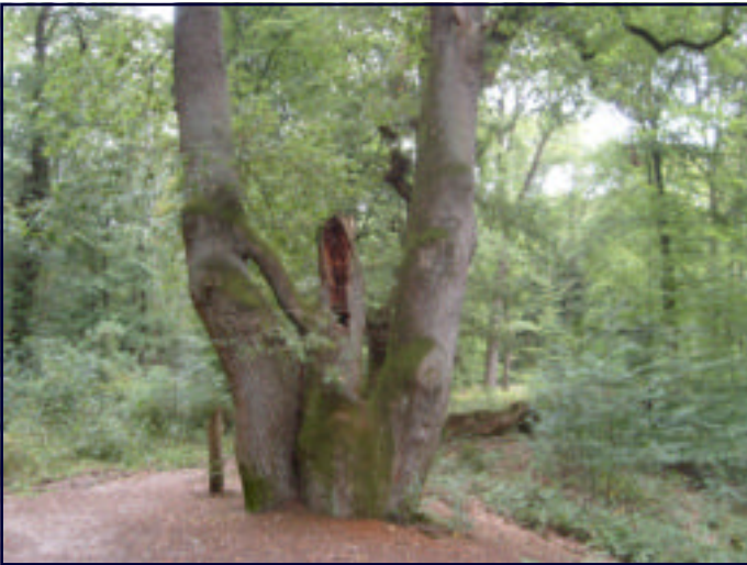
LEDENTOCHT 2009: IN ELKAAR GEGROEIDE EIKENBOMEN IN DE ZG ONZALIGE BOSSEN (NATIONAAL PARK DE VELUWEZOOM)