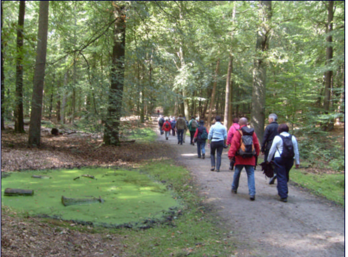
LEDENTOCHT: OP WEG NAAR DE VOLGENDE WANDELING.....?.....