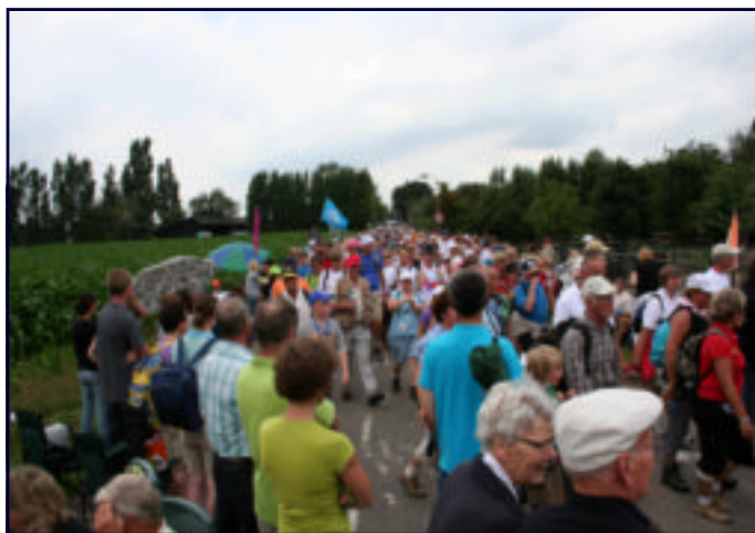
4D NIJMEGEN: TOPDRUKTE OP DE ROUTE (op 2e rij van achteren enkele WSV-ers)

DAT ER INTELLIGENTE BUITENAARDSE WEZENS BESTAAN WORDT FEILLOOS BEWEZEN DOOR HET FEIT DAT ZE NOG GEEN CONTACT MET ONS HEBBEN OPGENOMEN