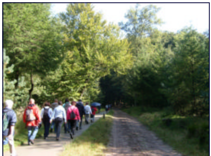
LEDENTOCHT SEPT 2009: EEN ENKELING HAD TIJDENS HET (VER)LOPEN ZELFS DE PARAPLU OPEN TER BESCHERMING TEGEN DE ZON

OKTOBER GEEFT ONS WIJN EN ZONNIGE DAGEN MAAR OOK JICHT EN ANDERE PLAGEN