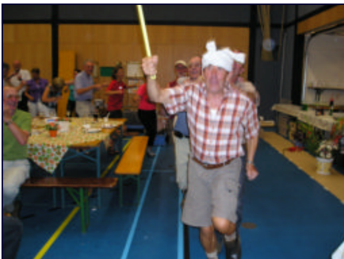
4D NIJMEGEN: LEIKE VOOROP IN DE POLONAISE