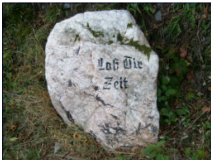
DAAR WETEN WIJ, WANDELAARS ALLES VAN!!!

Toch zoog ich ouch bie die wanjelvrouwluuj neet zoavääöl van die wanjelende paradiesveugel. Zouwe wanjelieeërs den toch tamelik normaal luuj zeen ?