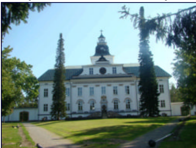
wandeling Finland: Gerechtsgebouw van Oud-Vaasa