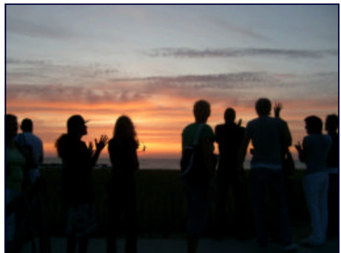
SPONTAAN APPLAUS NA SCHITTERENDE ZONDONDERGANG AAN DE NOORDZEE

BLAAST DE NOORDENWIND MET EEN DECEMBERMAAN DAN HOUDT DE WINTER VIER MAANDEN AAN