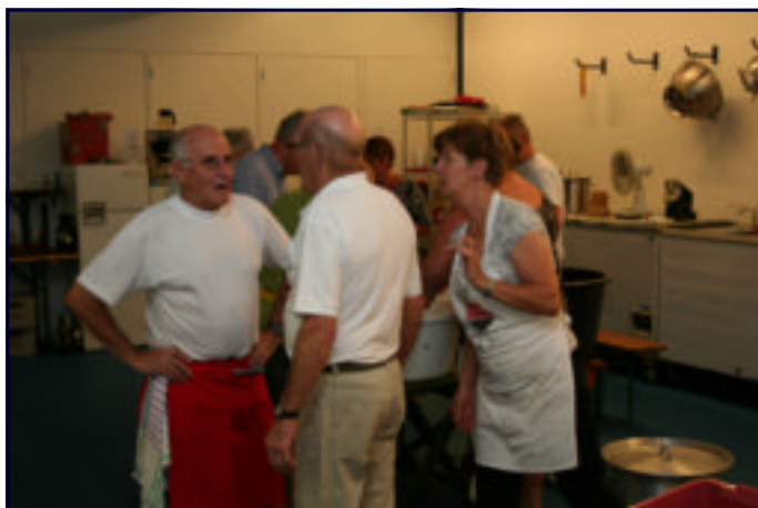
4D-NIJMEGEN: TOPOVERLEG IN DE KEUKEN

DAT ER INTELLIGENTE BUITENAARDSE WEZENS BESTAAN WORDT FEILLOOS BEWEZEN DOOR HET FEIT DAT ZE NOG GEEN CONTACT MET ONS HEBBEN OPGENOMEN