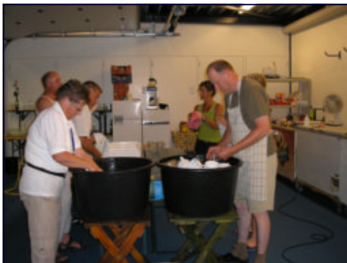
4D NIJMEGEN: SAMEN AAN DE AFWAS (voor de mannen: det môste ze thoes èns weite!)